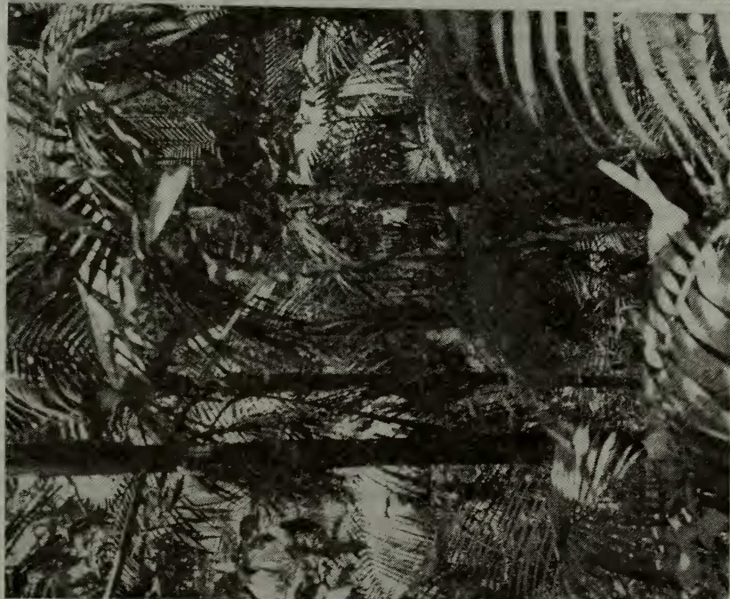
Fig. 3. El Bosque Nublado de la zona alta de Loma Quita Espuela está caracterizado por el predominio de la palma manacla ( Pretoea montana ).